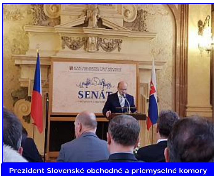
Prezident Slovenské obchodné a priemyselné komory

V průběhu večera Hospodářská komora ČR vyhlásila podnikatele století, kterým česká základna více jak 15.000 podnikatelských subjektů zvolila Tomáše Baťu . Na dalších místech se pak umístili Emil Škoda a František Křížík .