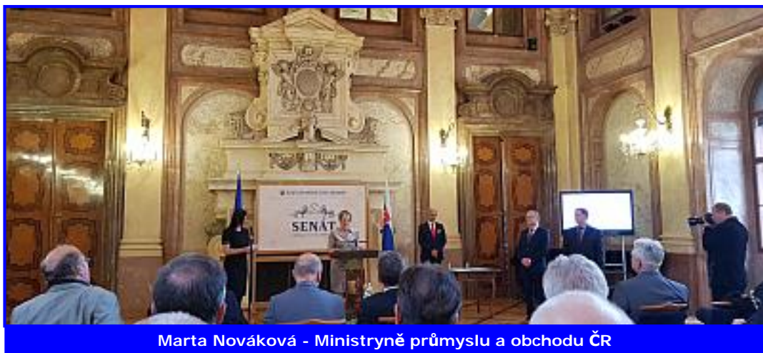
Marta Nováková - Ministryně průmyslu a obchodu ČR

Akce se tak zúčastnili i zástupci Slovenské a Zakarpatské komory, stejně jako si účast nenechal ujít předseda EUROCHAMBERS (Sdružení evropských hospodářských komor).